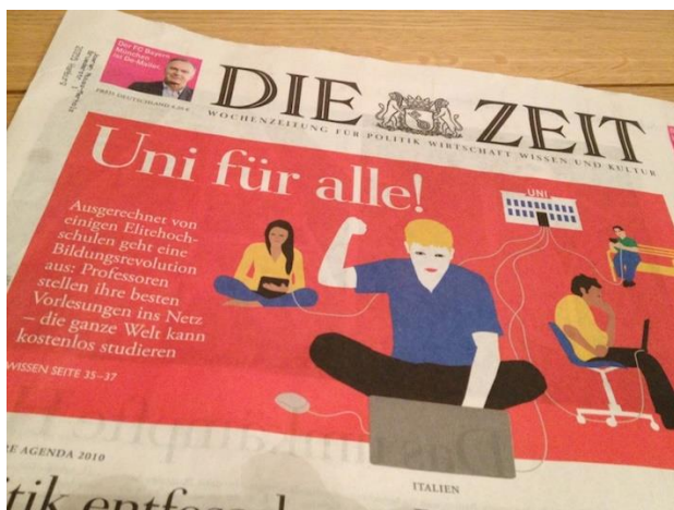
Foto des Titelblatts der "Zeit" zum Thema MOOCs von 2013

Große, offene Onlinekurse (Massive Open Online Courses – MOOCs) verbreiteten sich nach 2008 erst im englischsprachigen und in der Folge auch im deutschsprachigen Raum. 2013 sprach "Die Zeit" sogar von der „Bildungsrevolution“ auf ihrer Titelseite. Eine zentrale Eigenschaft der MOOCs ist das individuelle Lernen, bei dem man nicht an feste Zeiten, feste Orte oder andere Personen gebunden ist – und das ist gleichzeitig Vorteil wie auch Nachteil der MOOCs. Denn dadurch brauchen Lernende hohe Motivation und Disziplin, während gleichzeitig der Austausch mit anderen Lernenden nur eingeschränkt möglich ist.