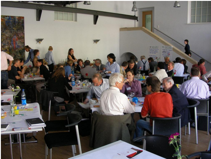
World Café: Diskussion in der Gruppe mit Café-Atmosphäre.

Der Austausch in Gruppen kann verschiedene Meinungen und Ideen zu einem Thema hervorrufen und zu neuen Erkenntnissen und Einsichten bei den Gruppenmitgliedern führen. Auf dieser Idee beruht auch die Methode des World Cafés. Sie soll Teilnehmende einer Veranstaltung (Tagung, Workshop, Seminar etc.) miteinander ins Gespräch bringen. Ähnlich wie in einem Café soll eine Atmosphäre geschaffen werden, die zu formlosen Gesprächen zu einem bestimmten Thema einlädt. Die Teilnehmenden wechseln nach einer bestimmten Zeit die Tische, die Gruppenzusammensetzungen verändern sich und die Ideen aus vorherigen Gesprächsrunden werden weitergetragen. Zum Abschluss werden im Plenum die wichtigsten Gesprächsergebnisse zusammengetragen.