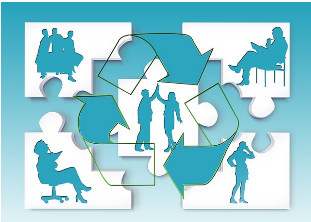
Quizen im Seminar

Den Unterricht individuell und kreativ zu gestalten, bedeutet nicht in jedem Fall, alle Bausteine selbst zu erstellen. Es gibt eine Reihe von Online-Übungen, die in den Kursablauf eingepasst werden können und eine Bereicherung darstellen. In diesem Artikel wird kurz erläutert, nach welchen Kriterien Online-Übungen gefunden werden können. Anhand eines konkreten Beispiels aus der politischen Erwachsenenbildung wird ein Einsatzszenario von fertigem Material erläutert. Die Verwendung fremder Materialien stößt immer dann an Grenzen, wenn Anpassungen gewünscht und notwendig sind. Der Artikel zeigt, wie man mit dieser Situation umgehen kann - in diesem Fall mit der Verwendung der Quiz-App kahoot , die es erlaubt, eigene Quiz zu erstellen.